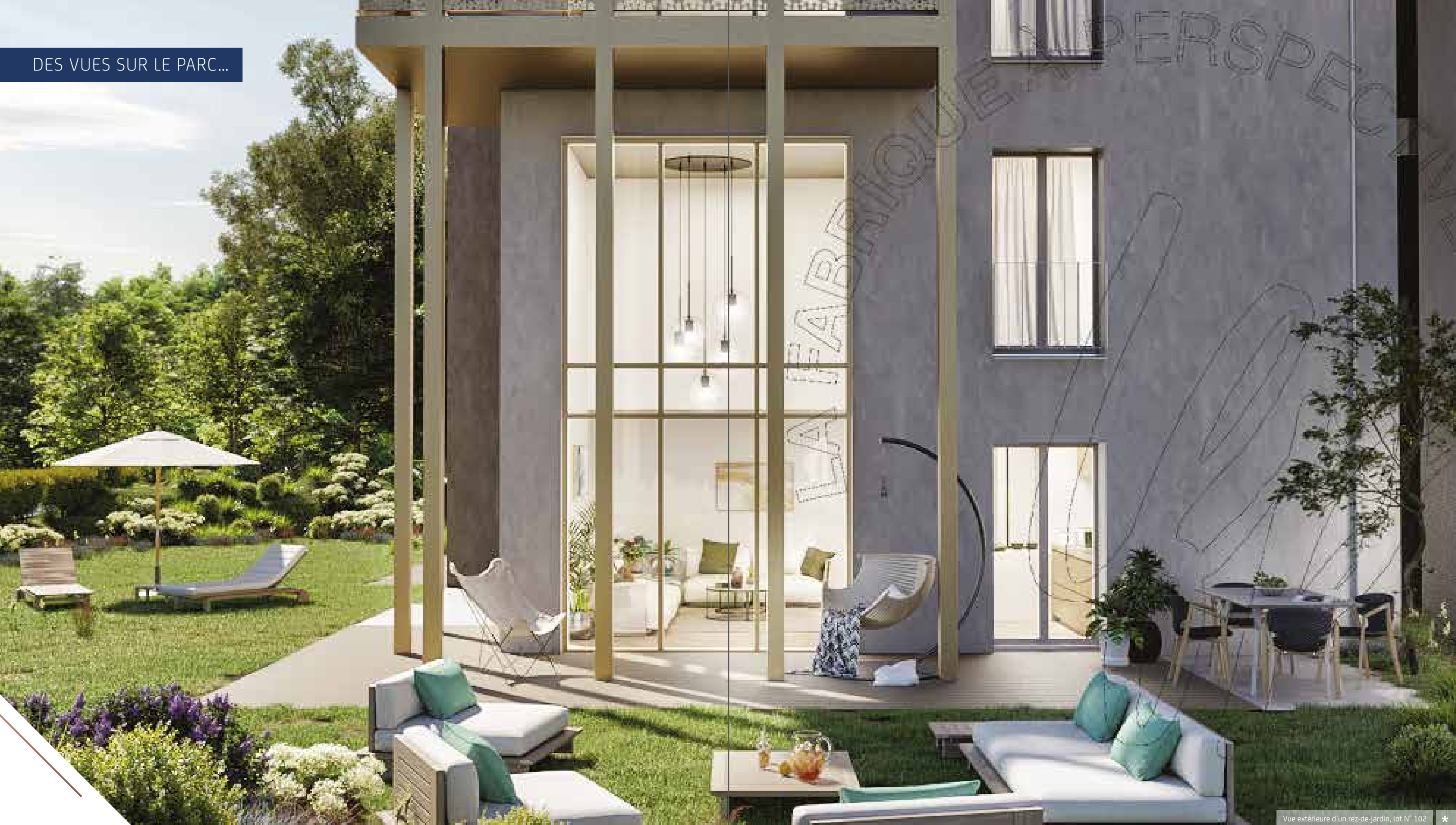
Vue extérieure d'un rez-de-jardin, lot N° 102 *