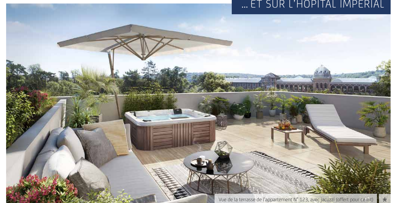
Vue de la terrasse de l'appartement N° 123, avec jacuzzi (offert pour ce lot) *