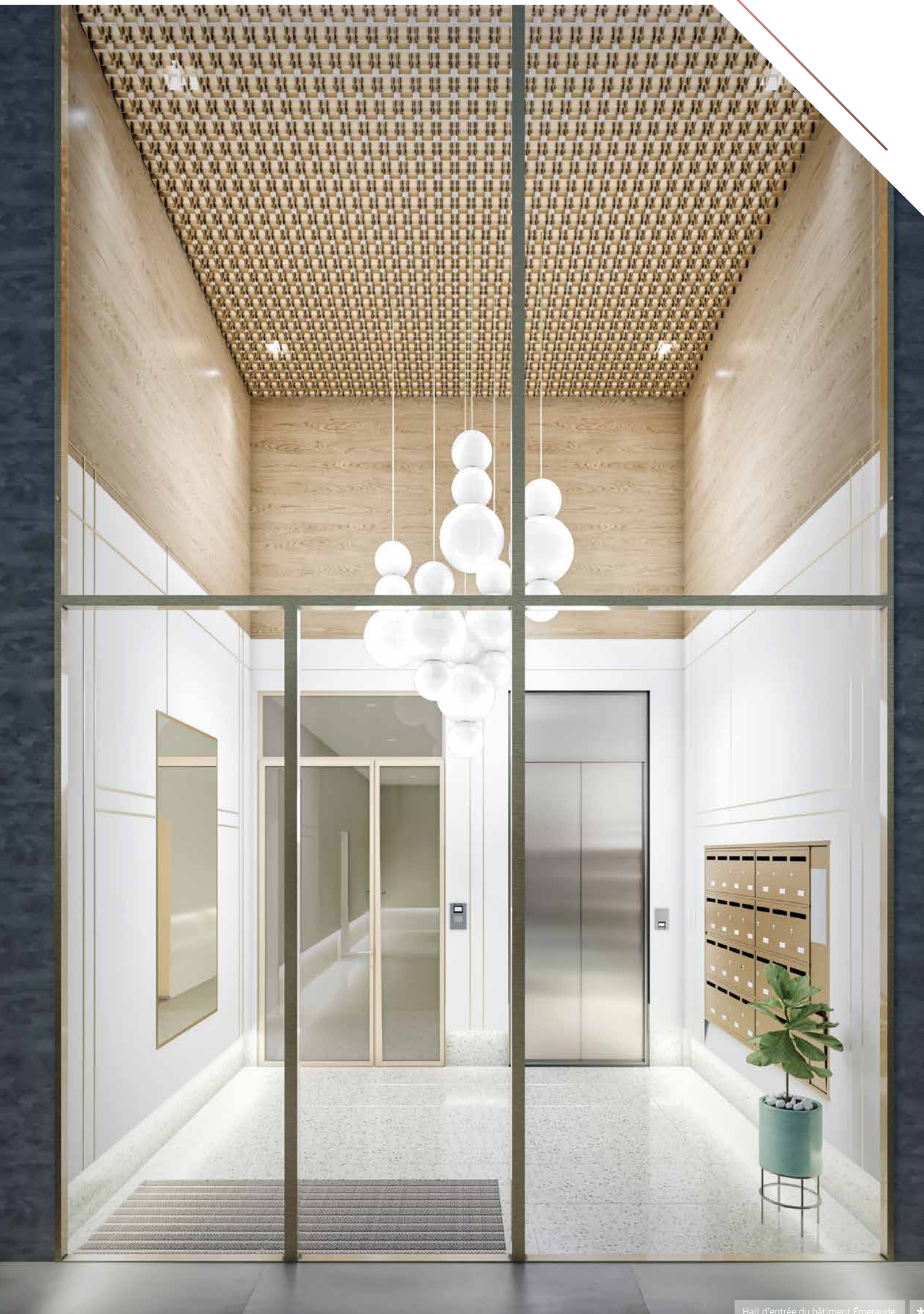
Hall d'entrée du bâtiment Émeraude *