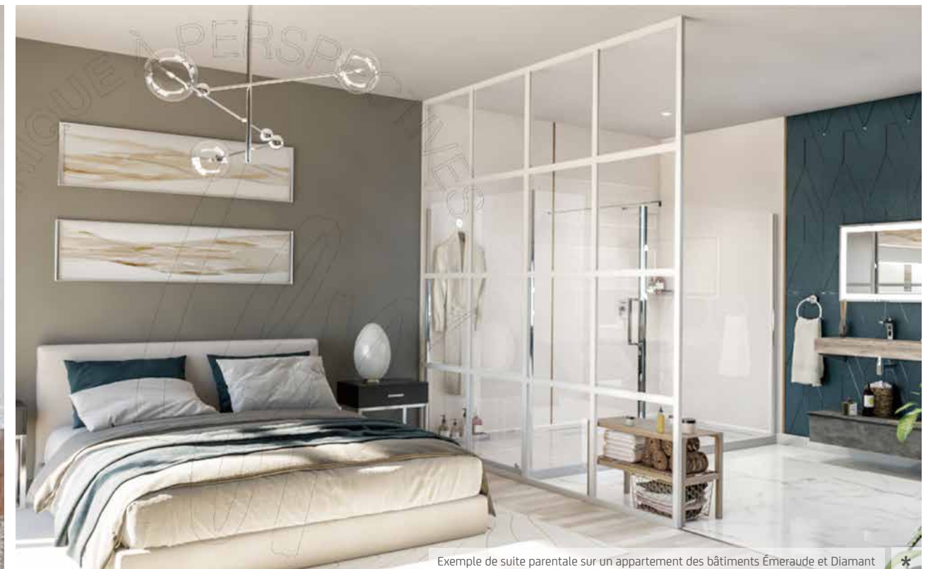
Exemple de suite parentale sur un appartement des bâtiments Émeraude et Diamant *