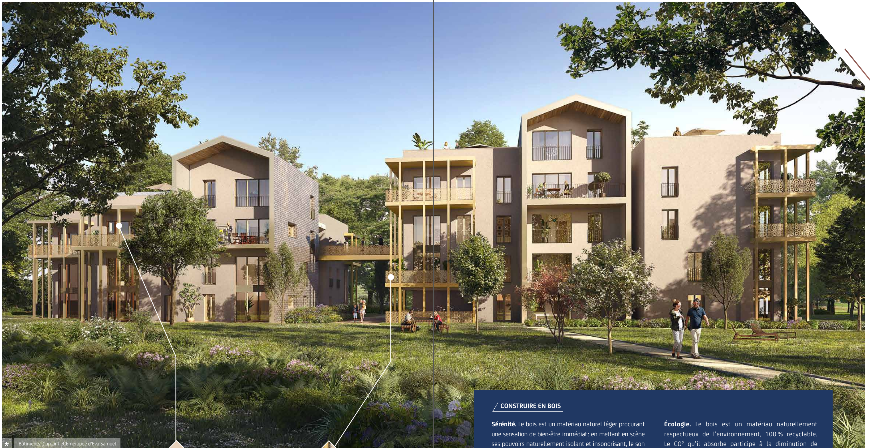
* Bâtiments Diamant et Émeraude d'Eva Samuel

Pergolas en acier thermolaqué teinte bronze