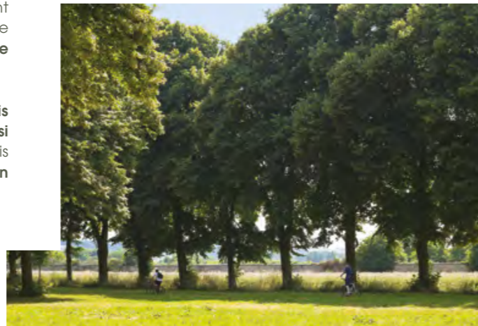
Allée vers Saint-Cyr

Sa renommée internationale et sa proximité avec Paris font de Versailles une place très prisée. Versailles est aussi une ville d'espaces verts . Parcs forestiers, nombreux bois et plus de trente squares, tout est propice à la respiration dans un cadre de vie exceptionnel .