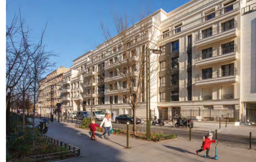
La Villa Perret à Levallois-Perret / 92 Architecte : DGM et associés

La galerie UNIVER fait partie des lieux symboliques choisis par Nacarat pour organiser des moments de convivialité avec ses clients, l'art donnant une autre valeur et une autre qualité à toute forme de communication. Dédiée à l'art contemporain, la galerie s'attache à suivre chaque année, à travers une dizaine d'expositions, l'évolution du travail des artistes et propose des découvertes.