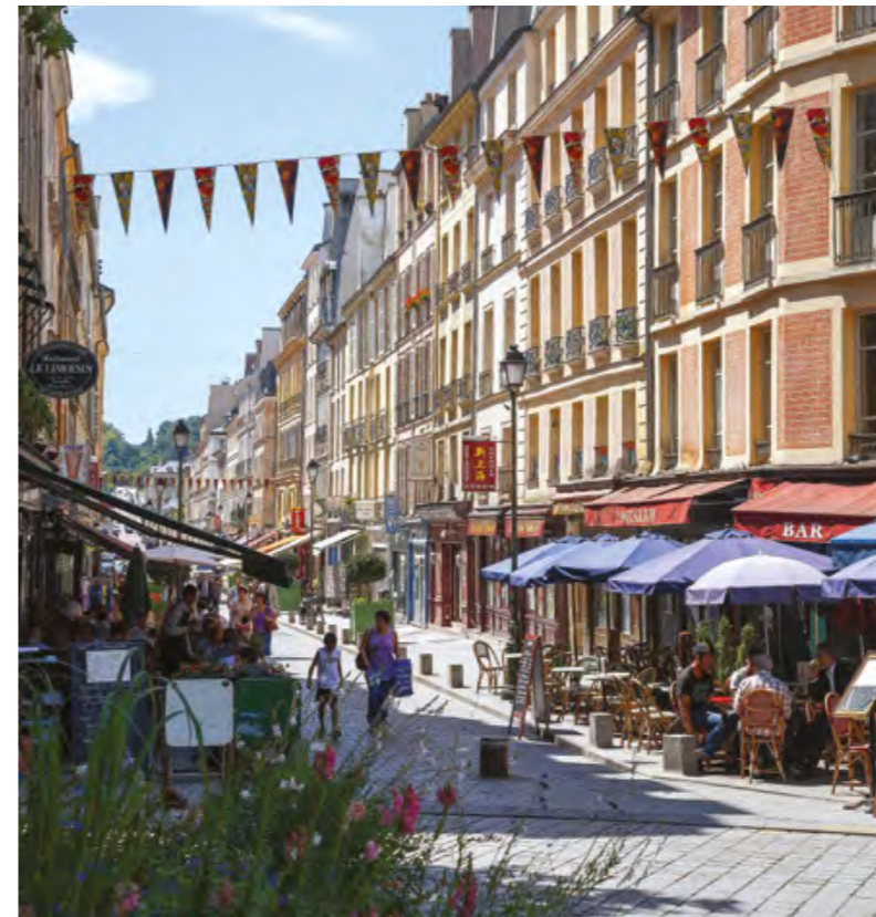
Rue de Satory

L'avenue de Paris est l'une des trois voies qui rayonnent en éventail depuis la place des Armes, devant le Château de Versailles. C'est sur cette emblématique artère arborée , à deux pas du domaine de Madame Élisabeth , que la nouvelle réalisation a été conçue pour s'ériger parfaitement en pleine harmonie avec l'esprit d'élégance qui habite Versailles. Cet emplacement de choix et son architecture traditionnelle, dans un grand jardin paysager, permettent de profiter de toutes les commodités, tout en savourant la quiétude des lieux.