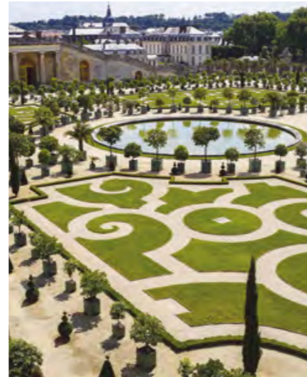
Le bosquets de l'Orangerie, Château de Versailles