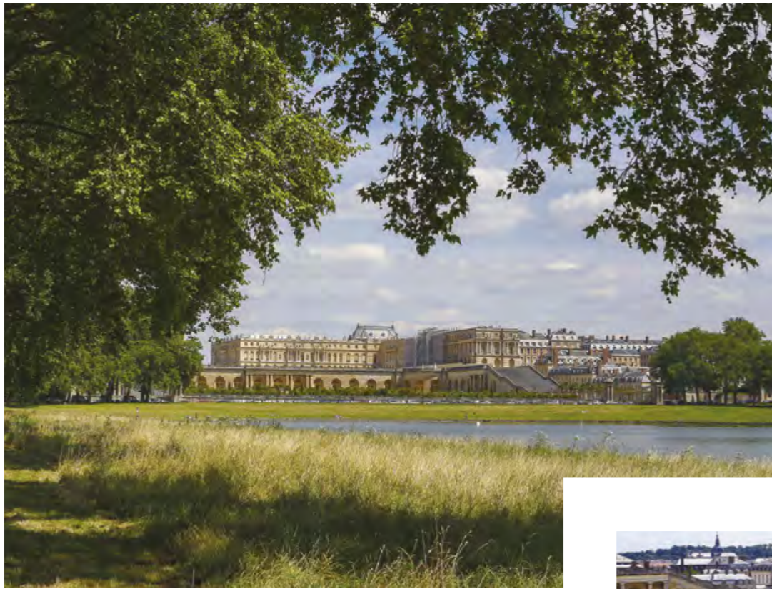
Allée du Mail, Château de Versailles