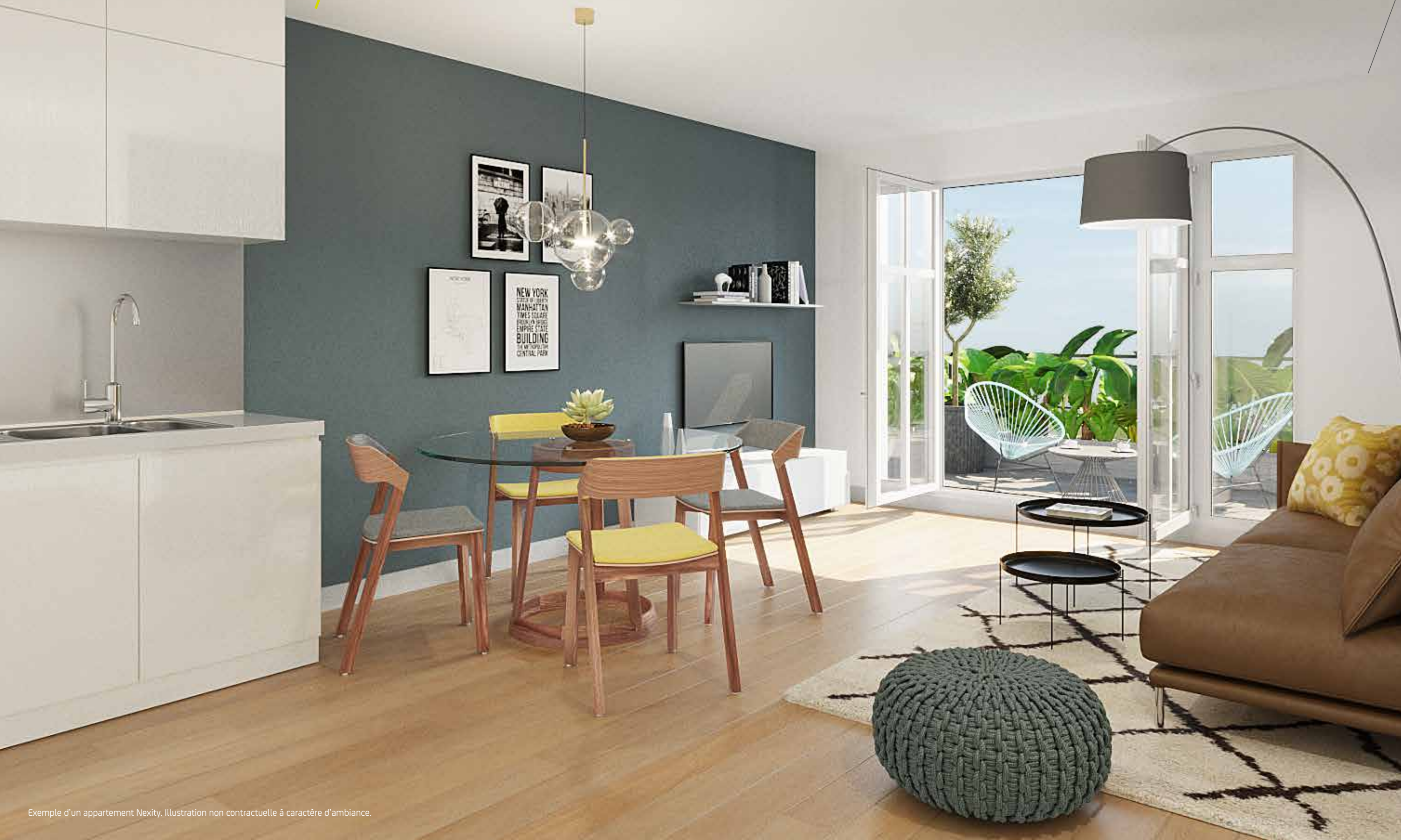
Exemple d'un appartement Nexity. Illustration non contractuelle à caractère d'ambiance.

Nexity accorde la plus grande importance à la qualité de vie au sein de ses logements.