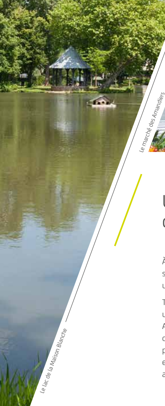
Le marché des Amandiers