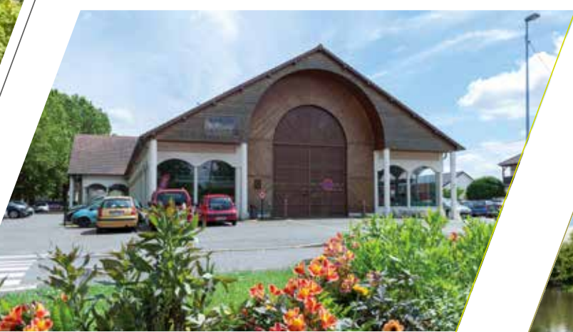
Le parc Courbet