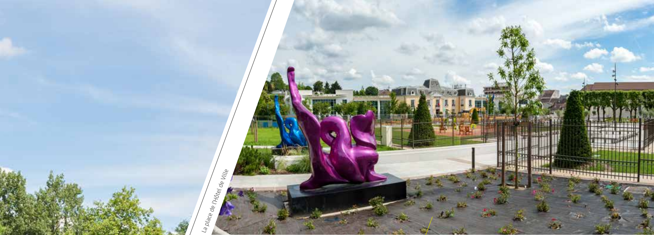
La place de l'hôtel de ville